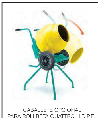
CABALLETE OPCIONAL PARA ROLLBETA QUATTRO H.D.P.E.

La basculación de la cuba es simple y segura. El caballete OPCIONAL IM2 1105490, gracias a sus cuatro puntos de apoyo, confiere a la ROLLBETA QUATTRO H.D.P.E. la máxima estabilidad.